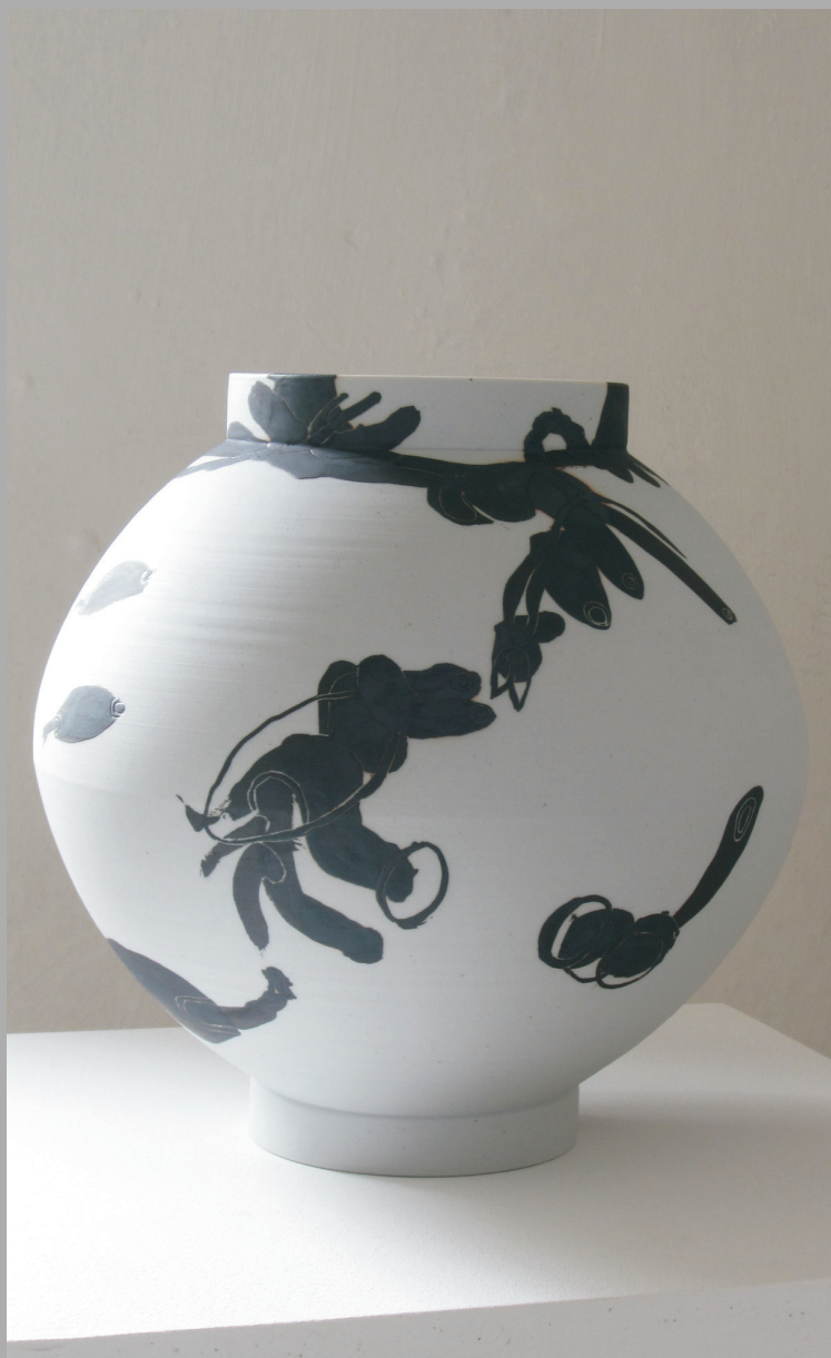
Jochen R  th/Georg Kleber

Neben den Arbeiten der vier Hauptakteure beim diesj  hrigen Sommerbrand zeigt die Galerie Faita auch Arbeiten von K  nstlern der Galerie.